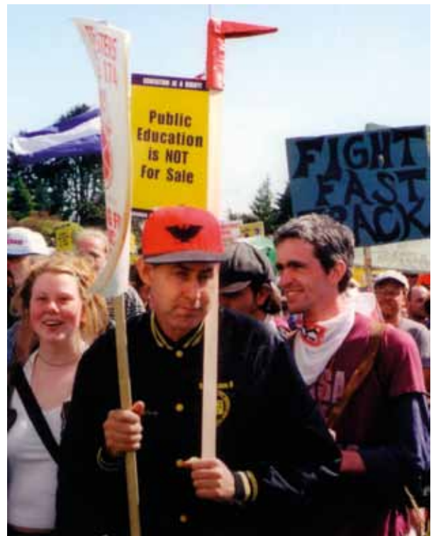
Kundgebung für öffentliche Dienste, Grenze Kanada-USA.

Starke Bündnisse, die auf dem öffentlichen Interesse und nicht dem Gewinnstreben der Unternehmen gründen, werden der Eckpfeiler aller unserer Initiativen sein, dieses außer Kontrolle geratene Wettrennen um die radikalste Wirtschaftsliberalisierung zu beenden.