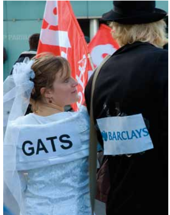
Protestkundgebung gegen Einfluss der Banken auf Handelsabkommen, Frankreich.

Die Verhandlungsführer bei den Handelsgesprächen und die sie unterstützenden Unternehmen behaupten oft, dass solche vorgeschlagenen Einschränkungen das „Recht auf Regulierung“ und auf Einführung neuer Regelungen anerkennen, aber dies ist irreführend. Das angebliche „Recht auf Regulierung“ kann nur in Übereinstimmung mit den im Abkommen festgelegten Verpflichtungen wahrgenommen werden, einschließlich der vorgeschlagenen Einschränkungen der innerstaatlichen Regelungen. 47 Auch wenn den Regierungen weiterhin überlassen bleibt, welche Ziele sie mit ihren Regulierungsmaßnahmen erreichen wollen, so bleiben die eingesetzten Mittel doch angreifbar und der Kontrolle des Streitschlichtungspanels unterworfen. 48