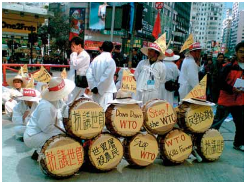
Koreanische Bauern protestieren gegen die WTO.

Ein bedeutender weiterer Schritt war die Anfrage Chinas, sich an den Gesprächen beteiligen zu dürfen. 3 Zum gegenwärtigen Zeitpunkt ist es schwierig zu prognostizieren, ob Chinas Beteiligung die TiSA-Ambitionen eher anstacheln oder dämpfen wird. Die US reagieren im Hinblick auf die chinesische Beteiligung zurückhaltend und wollen von dem Land zuerst die Verpflichtung auf „sehr ambitionierte Zielsetzungen“. 4 Chinas Haltung zum Thema Dienstleistungen in zwei laufenden Verhandlungsrunden, in denen es um die Erweiterung des WTO-Abkommens über die Informationstechnologie (ITA) und den Beitritt zum WTO-Übereinkommen über das öffentliche Beschaffungswesen geht, ist von der US-Regierung und Wirtschaftsverbänden unmissverständlich als unzureichend gerügt worden. Bis heute