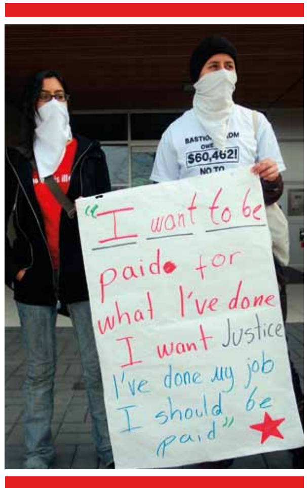
TISA bringt WanderarbeitnehmerInnen um ihre Rechte.

Von Bedeutung ist hier, dass die Modus 4-Verpflichtungen den Arbeitskräften keine Möglichkeiten bieten, einzuwandern oder einen Wohnsitz oder die Staatsangehörigkeit in dem Aufnahmeland zu erwerben. Ausländische Arbeitskräfte müssen nach Abschluss der Arbeiten oder nach Ablauf ihrer Aufenthaltserlaubnis im Gastland in ihre Heimatländer zurückkehren. Diese prekäre Situation macht die Arbeitnehmer abhängig vom guten Willen der Arbeitgeber. Falls sie ihre Arbeit verlieren, müssen sie das Aufnahmeland sofort verlassen. Trotz dieser Gefährdung wurden laut Berichten der US-Verhandlungsteams keine Vorschläge unterbreitet, im TiSA durchsetzbare Arbeitsnormen oder Arbeitsrechte zu verankern. 51