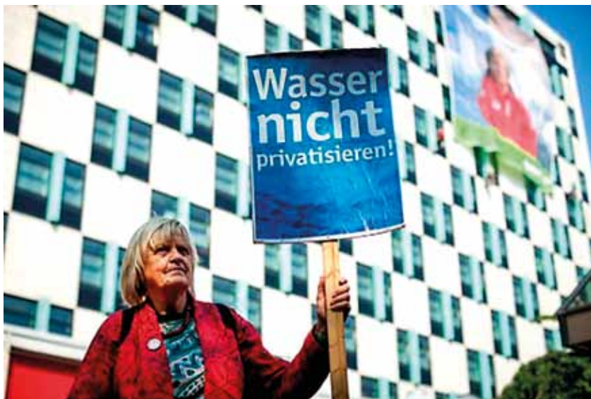
Kampagne für kommunale Wasserversorgung, Deutschland.

Eine der populärsten und auch machtvollsten Antworten auf die fehlgeschlagenen Privatisierungen ist der verstärkte Trend zur Rekommunalisierung . Dies bezeichnet den Prozess der Rückführung eines privatisierten öffentlichen Dienstes in die Obhut des öffentlichen Sektors. Diese Umkehr findet typischerweise auf der kommunalen Ebene statt, obwohl eine Rekommunalisierung im Prinzip auch auf regionaler oder sogar staatlicher Ebene durchgeführt werden kann. Praktisch jeder öffentliche Dienst, der einmal privatisiert wurde, kann wieder kommunalisiert werden.